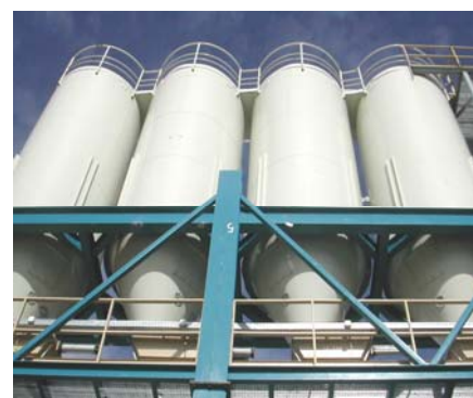
Envase: bidón 1.000 l